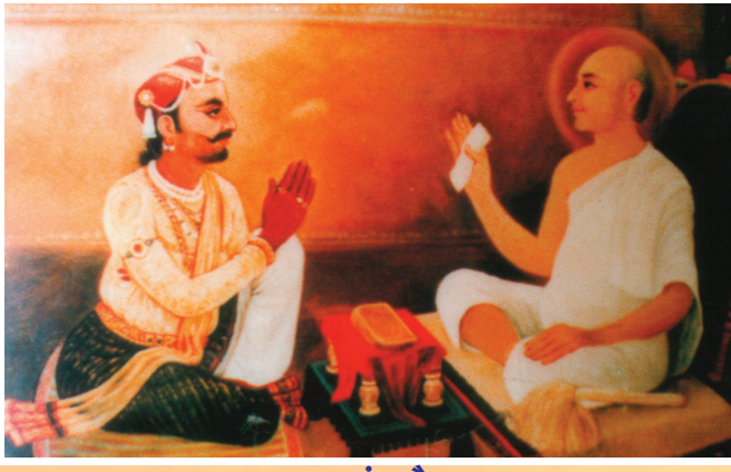
પાટણનું ગૌરવ કલિકાલ સર્વજ્ઞ શ્રી હેમચંદ્રાચાર્ય અને કુમારપાળ મહારાજ