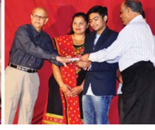
ગુજરાત રાજ્યમાં પ્રથમ આવનાર રાહુલ મોદીનું સન્માન