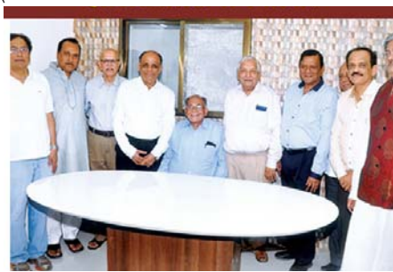
અતિથિગૃહ નૂતન કાર્યાલય ખાતે ઉપસ્થિત હોદ્દેદારો