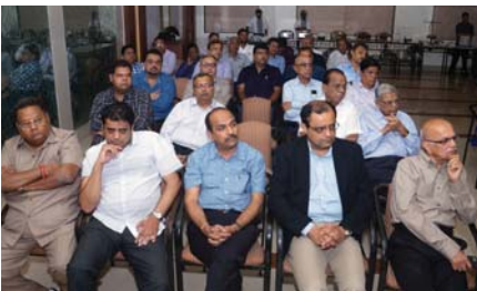
ઉપસ્થિત આમંત્રિત મહેમાનો