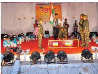
સ્પંદન ૨૦૧૬ના કાર્યક્રમની વિવિધ કૃતિઓ