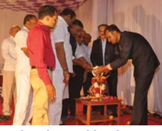
મહેમાનો તથા હોદ્દેદારો દ્વારા દિવ પ્રાગટ્ય