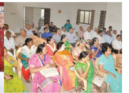
સમારંભમાં ઉપસ્થિત મહેમાનો - દાતાઓ