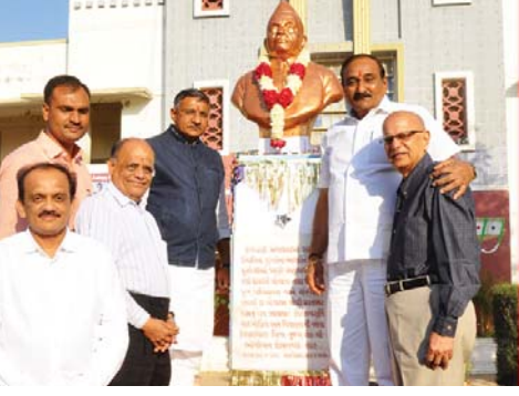
દાતાશ્રીની પ્રતિમાસાથે મહાનુભવો

ગત તા. ૧૮ ડિસેમ્બરના રોજ ભૂતપૂર્વ વિદ્યાર્થીઓના સ્નેહ મિલન સમારોહનું આયોજન સ્કુલના સેન્ટ્રલ હોલમાં થયું હતું.