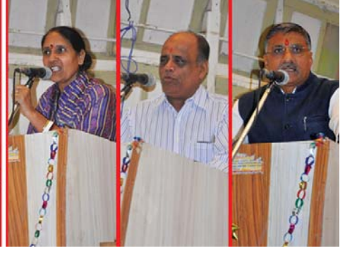
મહાનુભાવોનું પ્રાસંગિક ઉદ્બોધન