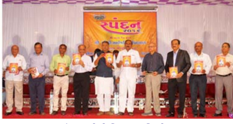
સૌરભ મેગેઝિનનું વિમોચન,