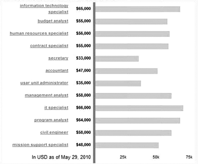
Average Salary of Jobs with Related Titles

“The biggest myth for parents in India is that their sons and daughters will get spoiled in an unsupervised environment with no family support.”