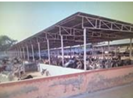
આધુનિક સુવિધા સભર પશુ શેડ

પૂ. ગુરુભગવંતોએ સાંજ સુધી પાંજરાપોળમાં સ્થિરતા કરી હતી અને પાંજરાપોળના વિવિધ વિભાગોની મુલાકાત લઈને કર્મચારીઓને જીવદયાનું મહત્વ સમજાવ્યું હતું. તે બદલ પાટણ પાંજરાપોળ પૂ. ગુરુભગવંતોનો આભાર માને છે.