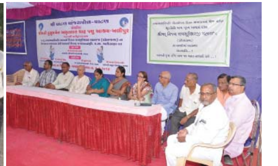
કાર્યક્રમમાં ઉપસ્થિત આમંત્રિત મહેમાનો, હોદ્દેદારો તથા સમિતિના સભ્યો