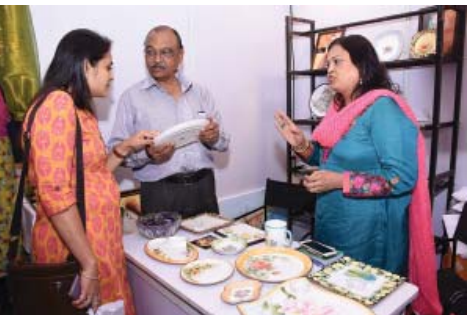
હેન્ડ પેઇન્ટેડ પ્લેટ્સ