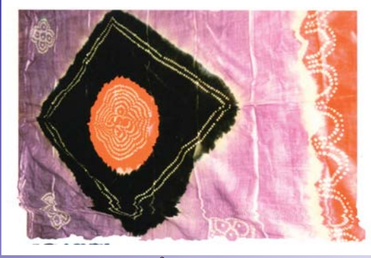
પાટણનું મશહૂર મશરૂ

ટેલિફોન : 2281 1346 • 22811218 • Mobile: 9167902267 • www.patanmandal.org • Email : patanmandal@gmail.com