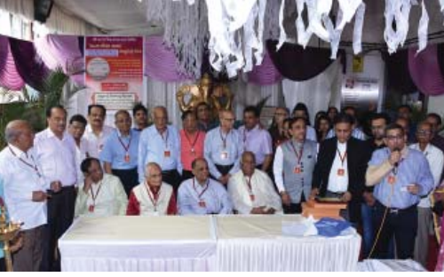
મંડળના હોદ્દેદારો તથા સોશિયલ એન્ડ ઈકોનોમિક અપ્લીફ્ટમેન્ટ કમિટિના સભ્યો