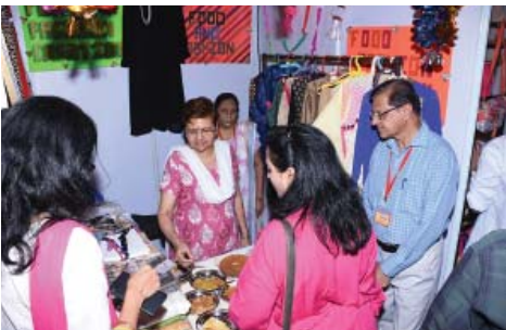
ફુડ એન્ડ ફેશન ક્રિએશન