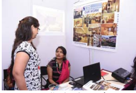
લાઈટીંગ એન્ડ ડિઝાઇનર્સ