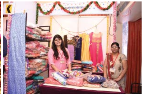
ફેસી અને મટીરીયલ