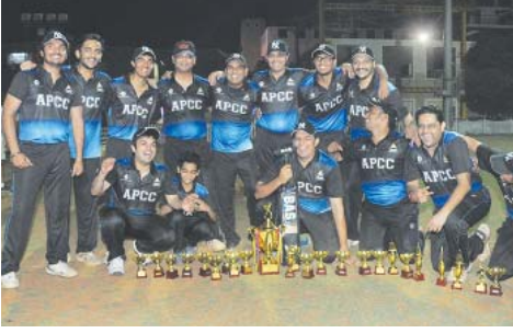
વિજેતા ટીમ - અંધેરી-વિલેપાર્લાના સભ્યો

શ્રી પાટણ જૈન મંડળ સ્પોર્ટ્સ સમિતિ આયોજીત મુંબઈના જુદાં જુદાં વિસ્તારોની ટીમોની ક્રિકેટ ટુર્નામેન્ટ ૨૦-૨૦ની ડે-નાઈટ ફાઈનલ મેચ રવિવાર, તા. ૨૮-૦૨-૨૦૧૬ સાંજના ૬.૦૦ વાગ્યાથી ગોરેગામ સ્પોર્ટ્સ ક્લબ ખાતે શ્રી મરીનડ્રાઈવ ક્રિકેટ ક્લબ V/S શ્રી અંધેરી - વિલેપાર્લા ક્રિકેટ ક્લબ વચ્ચે રમાયેલી. પ્રથમ બેટીંગ કરતાં શ્રી મરીનડ્રાઈવ ક્રિકેટ ક્લબ ૨૦ ઓવરમાં ૧૦૮ રન કર્યા હતા. શ્રી અંધેરી - વિલેપાર્લા ક્રિકેટ ટીમે ૧૭.૩ ઓવરમાં રવિકેટે ૧૧૦ રન કરી ૮ વિકેટથી વિજયી થઈ.