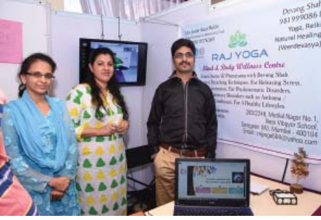
માનસીક અને શારિરીક શાંતિ માટે યોગા