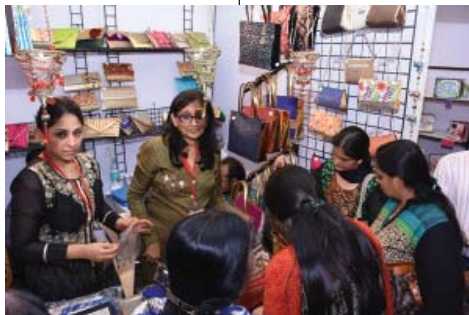
કલચીસ અને પર્સીસ