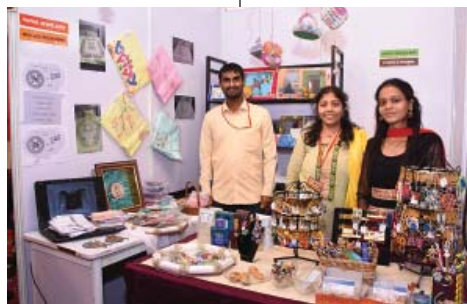
પેપર જ્વેલેરી - ક્વીલ્ડ ક્રિએશન