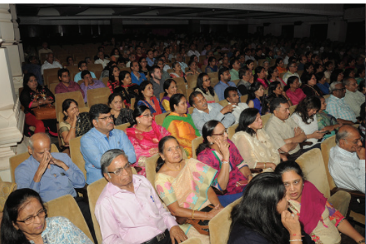
ઉપસ્થિત માનવ મહેરામણ તથા હોદ્દેદારો