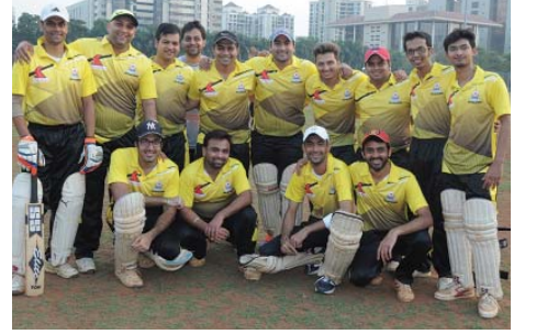
રનર્સ અપ ટીમ - મરીન ડ્રાઈવના સભ્યો