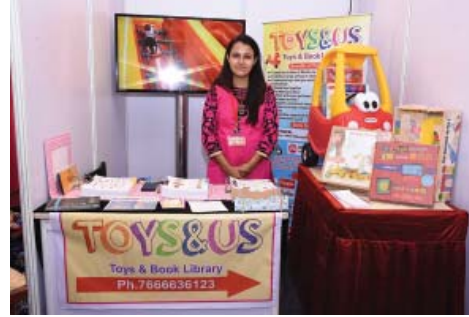
રમકડા ભાડેથી મળે છે