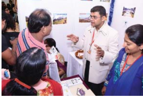
ટુસ એન્ડ ટ્રાવેલ્સ

અત્રે ખાસ ઉલ્લેખનીય રહેશે કે લગભગ ૯૬ સ્ટોલ ધારકો પૈકી કોઈક અતિશય જરૂરિયાતવાળા સદસ્યોને સ્ટોલના નિયત રકમમાં