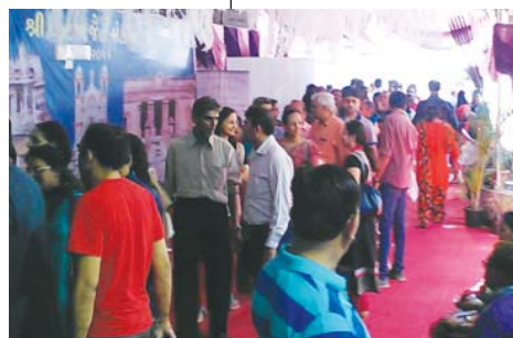
ઉમટેલ માનવ મેદની