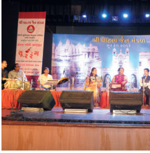
શ્રી આલાપદેસાઈ તથા સાથીવૃંદ