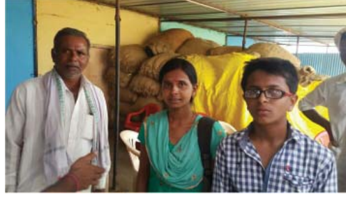
ખેડૂત પિતા સાથે B.E. કરતી પુત્રી અને NASAના ગોલ્ડ મેડલિસ્ટ પુત્ર