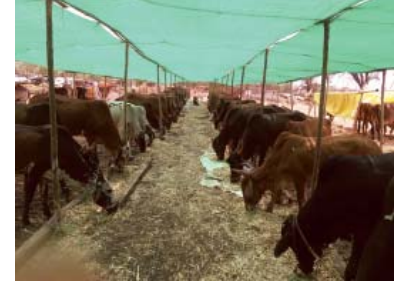
“કેટલ કેમ્પ” શેડમાં સુરક્ષિત પશુઓ

મહારાષ્ટ્રના મરાઠાવાડામાં અને લાતુર જિલ્લાના ગામડાઓમાં છેલ્લા બે વર્ષથી ભયંકર દુષ્કાળની પરિસ્થિતિ છે. પશુઓને ઘાસચારો અને માણસો માટે અનાજ નથી. પીવાના પાણીની ભયંકર તંગી છે. આવી પરિસ્થિતિમાં પોતાના નિર્વાહ માટે ખેડૂતો લાચારીથી પશુઓને વેચી પૈસા ઉભા કરે છે આ પશુઓને કતલખાને પણ જાય છે.