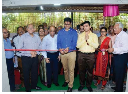
હેલ્થકેર સેન્ટરનું ઉદ્ઘાટન કરતા શ્રી પ્રેયસભાઈ અને શ્રી પ્રિયાંશુભાઈ