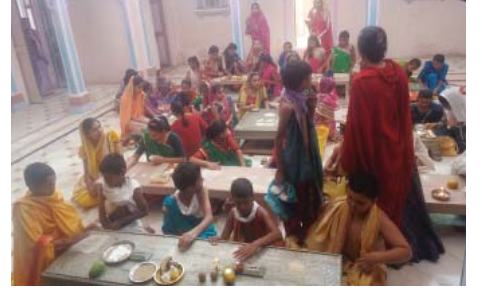
સામુદાયિક પ્રભુપૂજા કરી રહેલ શિબિરાર્થીઓ

પાટણ નગરની ધન્ય ધરા ઉપર ચૈત્ર વદ ૧, તા. ૨૩-૪-૨૦૧૬ થી ૨-૫-૨૦૧૬, ચૈત્રવદ ૧૦ દરમ્યાન ૧૦ દિવસની સંસ્કાર શિબિરનું આયોજન શ્રી પાટણ જૈન મંડળ સંચાલિત શ્રી સિદ્ધહેમ જ્ઞાનપીઠ - પાટણ શુભસ્થાને થયેલ. જેમાં પાટણ નગરના જ ૭ થી ૧૫ વર્ષની ઉંમરના - ૫૫ બાળકો જોડાયા હતા.