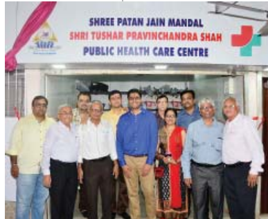
દાતા પ્રતિનિધિ સાથે હેલ્થકેર સમિતિના સભ્યો