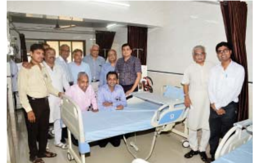
ડાયાલીસીસ મશીનના દાતાઓ તથા સંચાલકો