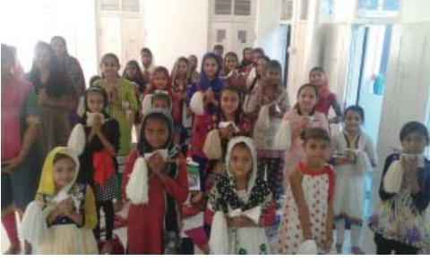
સામાયિક કરી રહેલ શિબિરાર્થીઓ