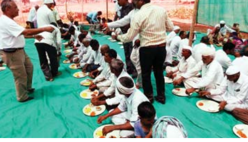
નિ:શુલ્ક ભોજનનો લાભ લેતા દુષ્કાળ પિડિતો