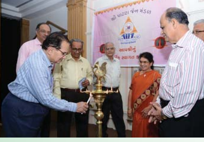
દીપ પ્રાગટ્ય કરતા મંડળના પ્રમુખશ્રી તથા ડૉક્ટર્સ