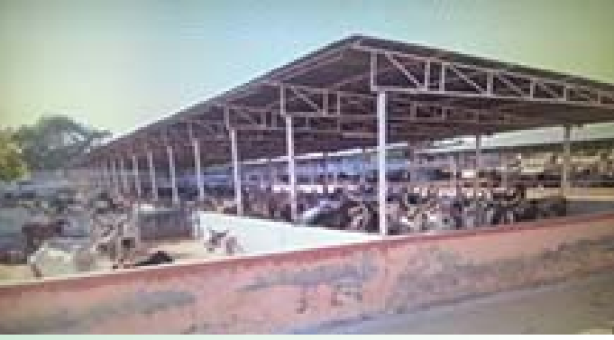
આધુનિક-સુવિધા સભર પશુ શેડ

દાતા અને જીવદયા પ્રેમીઓમાં અત્યંત લાગણીઓનો સંચાર થયેલ છે. આ સંપૂર્ણપણે વિસ્તરણ પામેલી શ્રી પાટણ પાંજરાપોળને ગુજરાત સરકારની રમત-ગમત અને સાંસ્કૃતિક પ્રવૃત્તિઓના વિભાગ દ્વારા ગુજરાત રાજ્યના સ્થાપના દિને તા. ૧-૫-૨૦૦૬ના રાજ્યપાલશ્રી અને મુખ્યમંત્રીશ્રીના વરદ હસ્તે પોરબંદર મુકામે ગુજરાત રાજ્યની શ્રેષ્ઠ પાંજરાપોળનો “શ્રી મહાવીર જીવદયા એવોર્ડ - ૨૦૦૬”, પારિતોષીક, મોમેન્ટો, પ્રસસ્તિપત્ર સાથે રૂા. ૫૧૦૦૦નો ચેક એનાયત કરી બહુમાન કરવામાં આવ્યું હતું.