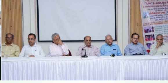
આમંત્રિત ડૉક્ટરો તથા સંસ્થાના હોદ્દેદારો