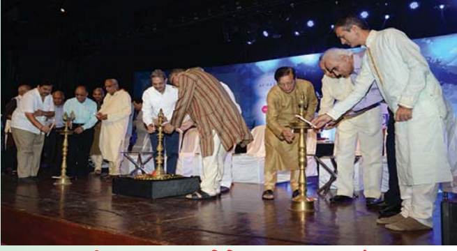
દીપ પ્રાગટ્ય કરતા વિવિધ સમાજના મહાજનો