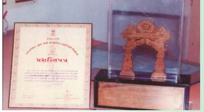
શ્રેષ્ઠ પાંજરાપોળનો શ્રી મહાવીર જીવદયા એવોર્ડ-૨૦૦૬

પશુ આશ્રય સંકુલ પરિસરમાં તળાવ પણ આવેલ છે, જ્યાં જીવોને ચારા અર્થે લઈ જવામાં આવે છે તથા નિર્મળ જળ પીવડાવવામાં આવે છે. મજકુર સમયે પ્રત્યેક ખાલી પડેલ શેડોની