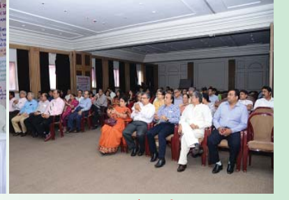
ઉપસ્થિત ડૉક્ટર્સ તથા સંસ્થાના કાર્યકર્તાઓ

શ્રી પાટણ જૈન મંડળની મેડીકલ સમિતિ દ્વારા તબીબી પ્રોફેશન સાથે સંકળાયેલ પાટણના ડૉક્ટરો તેમજ પાટણ જૈન મંડળની મેડિકલ સમિતિના કાર્યકરો અને હોદ્દેદારોના ગેટ ટુ ગેઘર કાર્યક્રમ બોમ્બે હોસ્પિટલ ઓડીટોરીયમમાં તા. ૧-૧૧-૨૦૧૫ના રવિવારે સવારે ૮.૩૦ થી ૧૨.૩૦ યોજવામાં આવેલ.