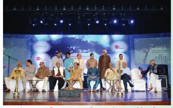
મંચ પર ઉપસ્થિત મહાનુભવો તથા સંસ્થાના હોદ્દેદારો

જેના કારણે પશુઓના રોમે રોમમાંથી ઉદ્ભવતા શાંતિના સ્પંદનો સંસ્થાના કાર્યકરોના હૃદયને ઠારે છે.