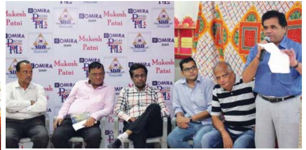
Sponsors & Office Bearers