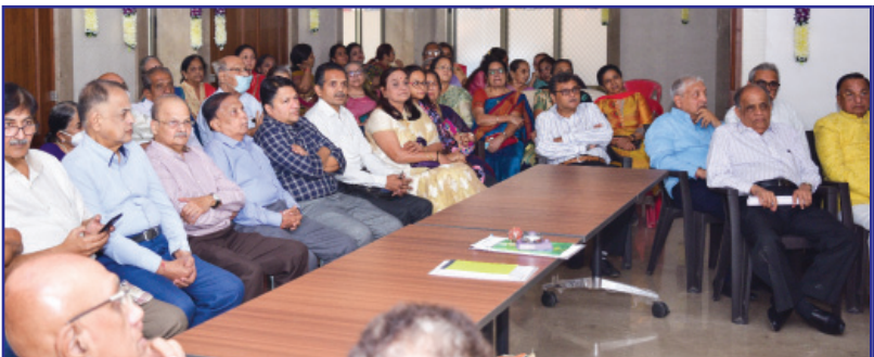
ઉપસ્થિત જન સમુદાય