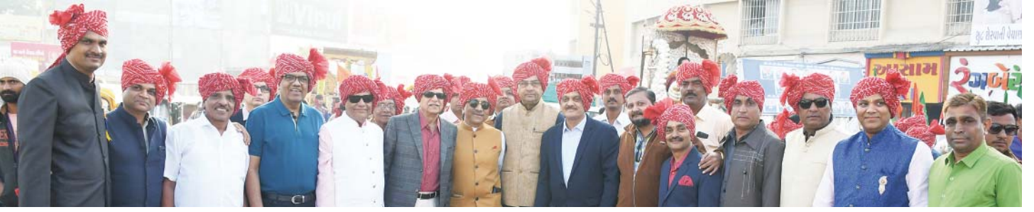
શોભાયાત્રામાં ઉપસ્થિત મંડળના તથા વિદ્યાલયના હોદ્દેદારો, આમંત્રિત મહેમાનો તથા ભૂતપૂર્વ વિદ્યાર્થીઓ