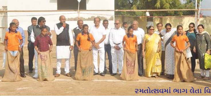
રમતોત્સવમાં ભાગ લેતા વિદ્યાર્થીઓ અને સંચાલકો