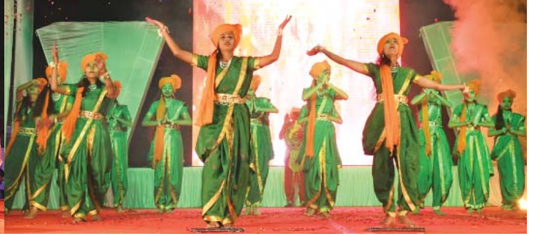
“સ્પંદન” કાર્યક્રમમાં પ્રદર્શિત થયેલ વિદ્યાર્થીઓની પ્રતિભાની ઝલક...