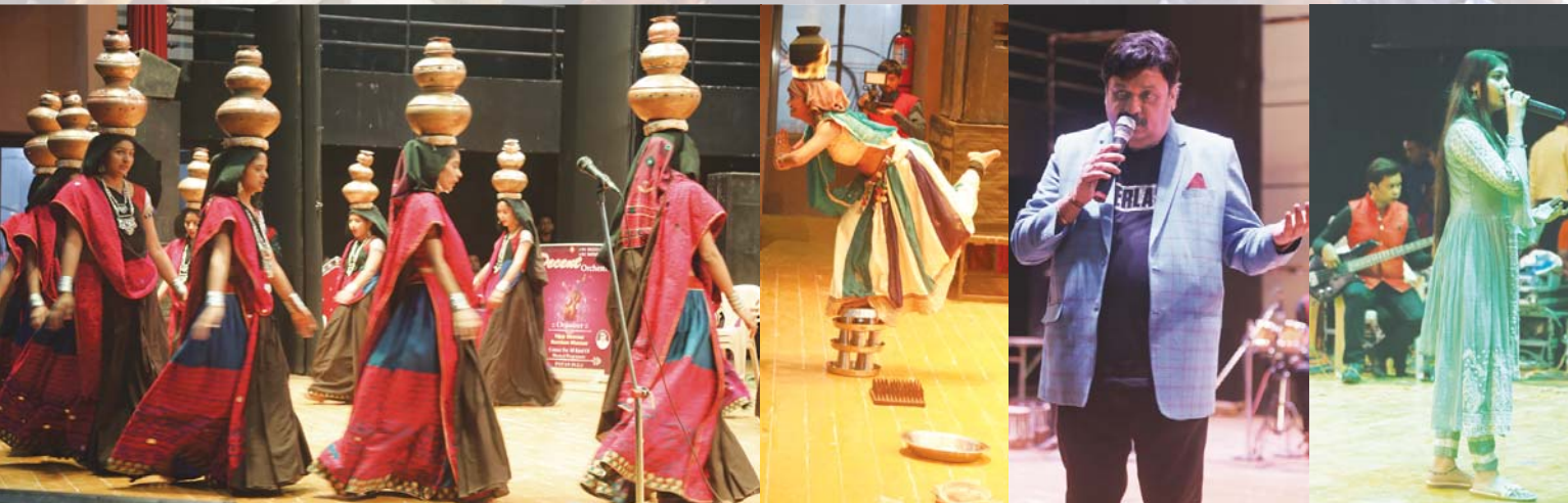
પાટણ ખાતે સંસ્થાની શતાબ્દી ઉજવણી નિમિત્તે પ્રસ્તુત થયેલ રંગારંગ કાર્યક્રમ

માથે સળગતા તાંબાના બેડા સાથે ડાન્સ કરી આ બેડામાં લાઈવ ચા