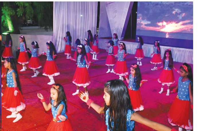
“સ્પંદન” કાર્યક્રમમાં શાળાના તેજસ્વી તારલાઓ દ્વારા પ્રસ્તુત થયેલ કૃતિઓ