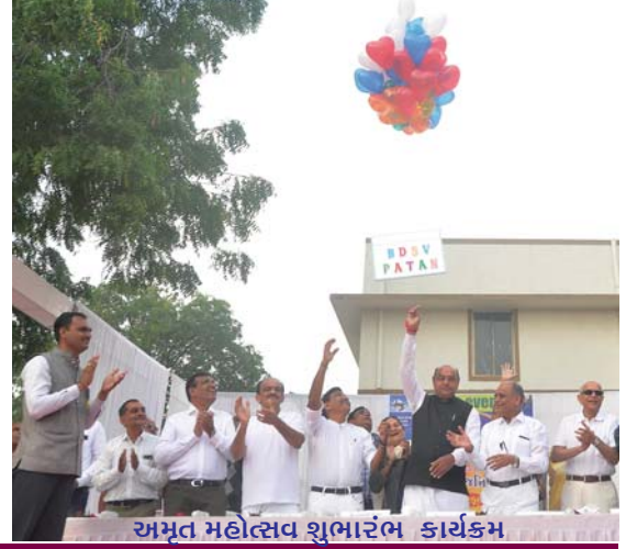
અમૃત મહોત્સવ શુભારંભ કાર્યક્રમ

સને ૨૦૧૯-૨૦નું સમગ્ર વર્ષ “અમૃત મહોત્સવ ઉજવણી વર્ષ”ના અંતર્ગત પાટણ તથા મુંબઈ ખાતે ચાર કાર્યક્રમોના સફળ આયોજન બાદ તા. ૧૩-૧૪-૧૫ ડિસેમ્બરના રોજ પાટણ ખાતે ત્રિદિવસીય ઉજવણીનો ભવ્ય કાર્યક્રમ સંપન્ન થયો. અમૃત મહોત્સવ ઉજવણીની પૂર્વ સંધ્યાએ સમગ્ર બી. ડી.એસ. વિદ્યાલય પરિસર અદ્ભુત નયનરમ્ય રંગોળી, સુશોભિત સ્વાગત ગેટ, ઠેરઠેર શાળાની સિદ્ધિઓ દર્શાવતા કટાઉટ્સ અને લાઈટની રોશનીઓથી ઝળહળતું હતું. સમગ્ર કેમ્પસ રજવાડી ઠાઠ સમુ દિશતું હતું.