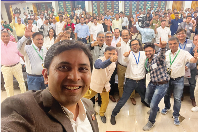
Selfie Taken By Speaker With Youngsters