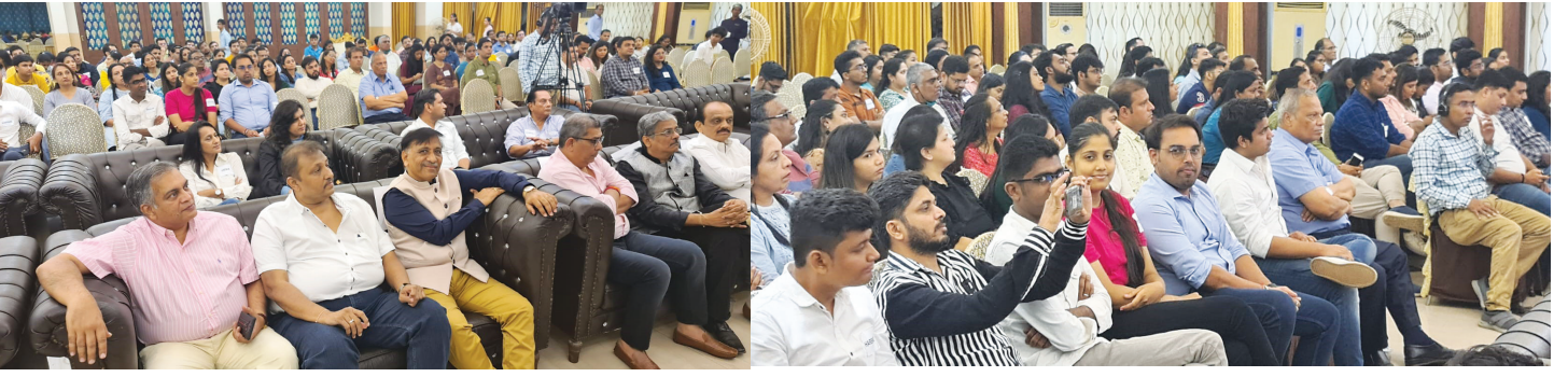
President and Office Bearers at the Event with Youngsters