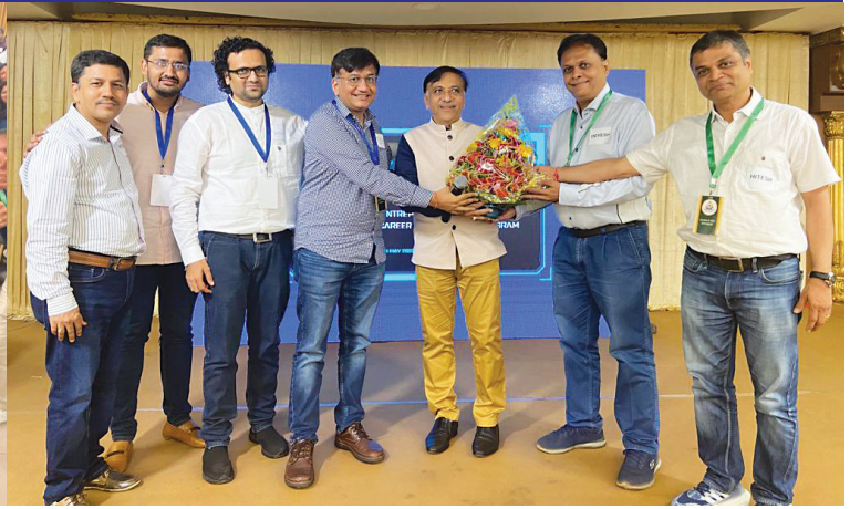
Felicitation of President by Youth Empowerment Core Team

Shree Patan Jain Mandal Youth Empowerment Committee organised their first programme for the youth of Patan Samaj at Ajivasan Hall, Santacruz West, Mumbai on Sunday 8th May, 2022 from 9 am to 3 pm.