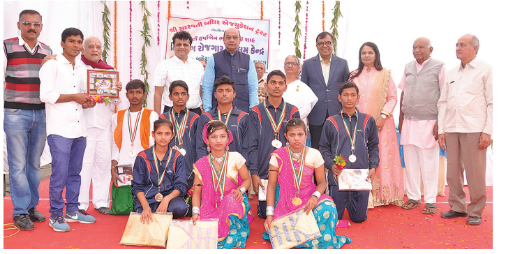
મહાનુભવો સાથે ખેલમહાકુંભના વિજેતા વિદ્યાર્થીઓ