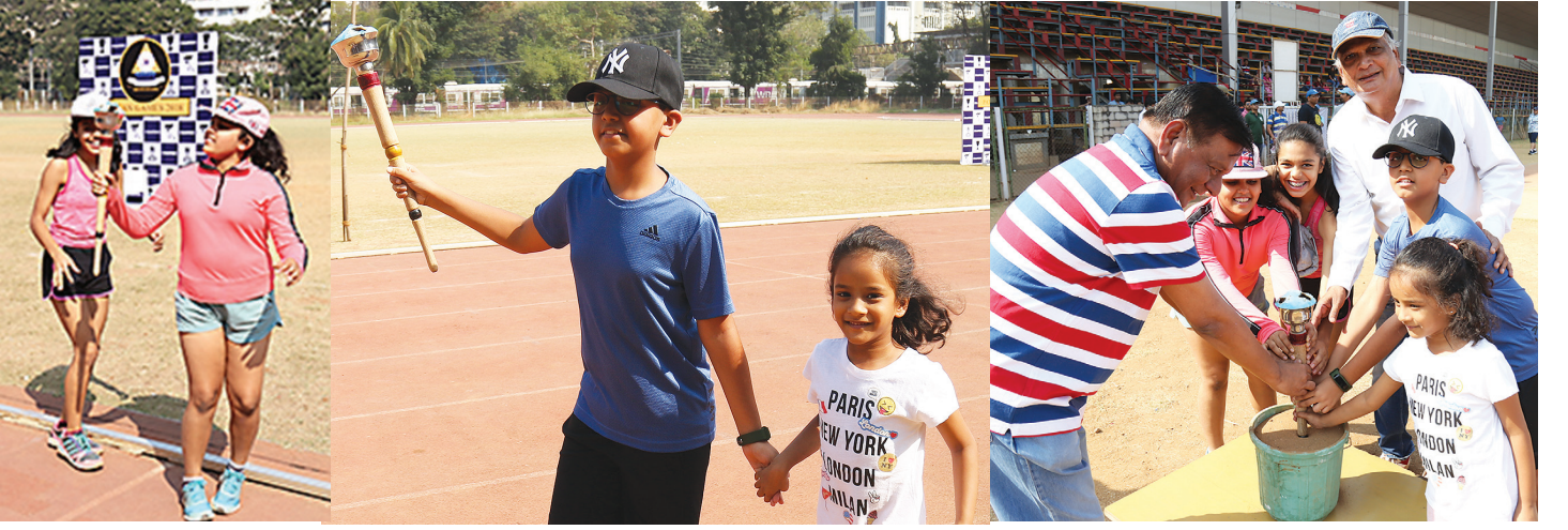
આઉટ ડોર ગેમ એથ્લેટીક્સ રમતોત્સવનું ઉદ્ઘાટના કરતા બાળકો તથા મંડળના હોદ્દેદારો