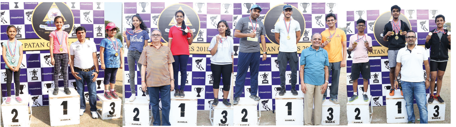
સ્પર્ધામાં જીતનાર બાળકોને મેડલ પહેરાવનાર મંડળના પ્રમુખ તથા વિવિધ સમિતિના માનદમંત્રીઓ