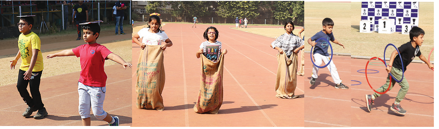
વિવિધ રમતોમાં ભાગ લેનાર સ્પર્ધકો

લેનાર ખેલાડીઓને પ્રોત્સાહિત કરવા મોટી સંખ્યામાં જનસમુદાય ઉપસ્થિત રહ્યો હતો.