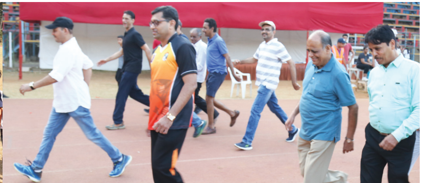
ચાલવાની સ્પર્ધા માટે તૈયાર મંડળના પ્રમુખ અને સભ્યો