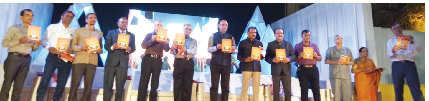
“સૌરભ-૨૦૧૮” મેગેઝિનનું પ્રકાશન કરતા ઉપસ્થિત મહાનુભાવો