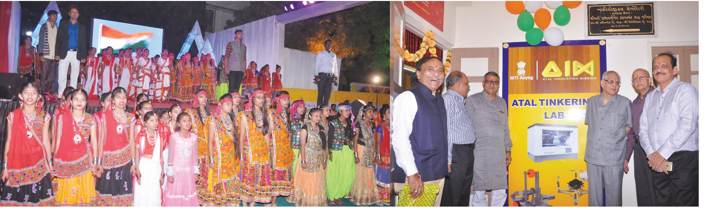
સાંસ્કૃતિક કાર્યક્રમ કરતા વિદ્યાર્થી-વિદ્યાર્થીનીઓ