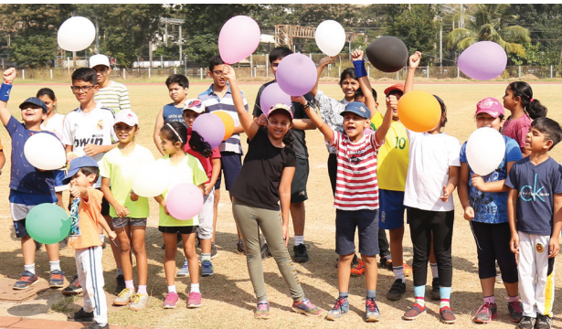
ફુગ્ગા ઉડાવતા સ્પર્ધામાં ભાગ લેનાર બાળકો