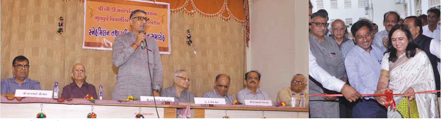
ભૂતપૂર્વ વિદ્યાર્થીઓને પ્રોત્સાહિત કરતા સ્નેહમિલન સમારોહમાં ઉપસ્થિત મંયસ્થ હોદ્દેદારો