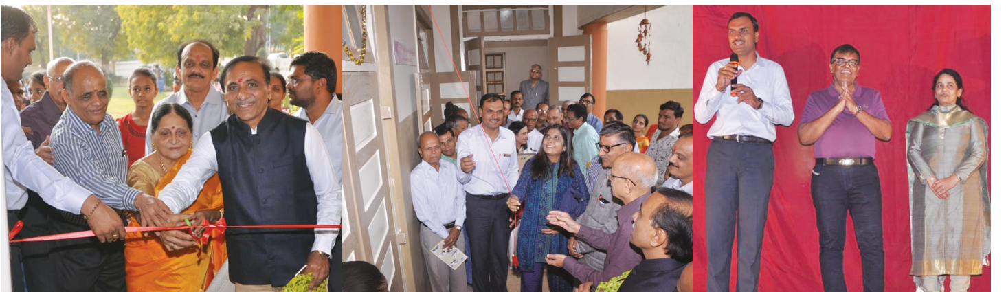
સ્માર્ટ ક્લાસનું ઉદ્ઘાટન કરતા મહાનુભાવો

આ ઉપરાંત સેન્ટ્રલ ગર્વમેન્ટ દ્વારા અટલ ટીકરીંગ લેબ માટે