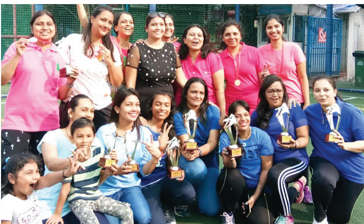
બન્ને ટીમના ખુશખુશાલ ખેલાડીઓ તથા બાળકો