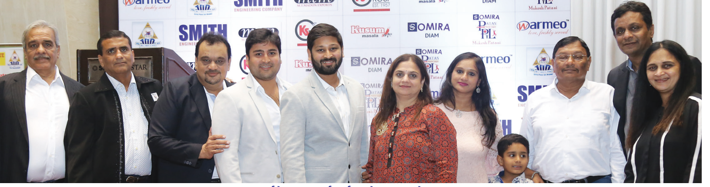
ટુર્નામેન્ટના પાર્ટનર્સ અને મુખ્ય સ્પોન્સર

ગત વર્ષે શ્રી પાટણ જૈન મંડળ દ્વારા યોજાયેલ પાટણ પ્રિમિયર લીગ ટુર્નામેન્ટને મળેલ અદભૂત સફળતા બાદ ચાલુ સાલે પણ ક્રિકેટ ટુર્નામેન્ટનું વિશાળ પાયો ઉપર આયોજન કરવામાં આવેલ છે. આ વખતે ભાગ લેવા ૧૬૦ ખેલાડીઓએ ઓનલાઈન રજીસ્ટ્રેશન કરાવેલ.