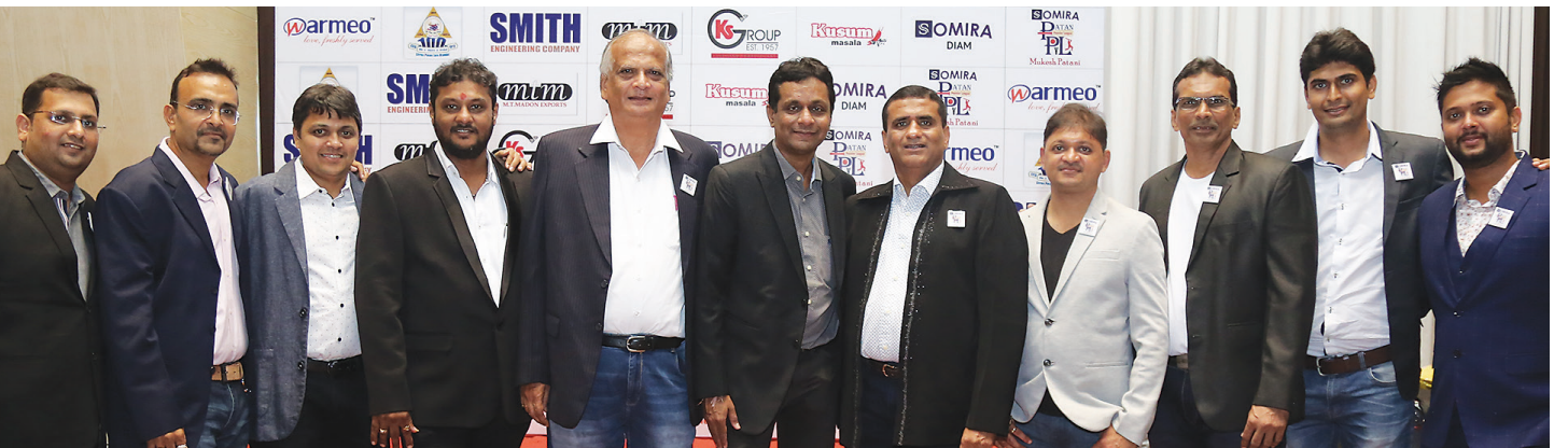
સ્પોર્ટ્સ સમિતિના હોદ્દેદારો અને સભ્યો

આ ઓક્સનમાં સાતેય ટીમો દ્વારા પસંદ થયેલ ખેલાડીઓ બાદ શેષ રહેલ અનસોલ ખેલાડીઓએ પોતાની ભરેલ ડિપોઝીટ મંડળના ત્રણેય કાર્યાલય ખાતેથી વહેલામાં વહેલી તકે મેળવી લેવા વિનંતી છે.