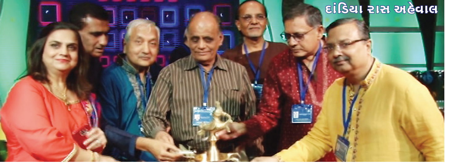
હોદ્દેદારો દ્વારા દીપ પ્રાગટ્ય

શ્રી પાટણ જૈન મંડળ દ્વારા ચાલુ સાલે તેની ભવ્ય શતાબ્દી ઉજવણી નિમિત્તે યોજાતા કાર્યક્રમો અન્વયે તા. ૩૦-૦૯-૨૦૧૮ના સહારા સ્ટાર ખાતે દાંડિયા રાસનો રંગારંગ કાર્યક્રમ યોજાયેલ. સાંજે ૭.૩૦ કલાકે શરૂ થનાર કાર્યક્રમ માટે અનન્ય ઉત્સાહથી સજ્જ થઈને રાસ રસિયાઓ સાંજે ૬ વાગ્યાથી જ આવવા શરૂ થયા હતા.