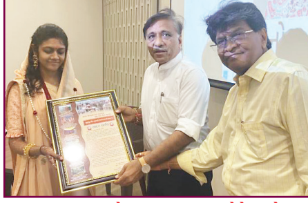
સન્માનપત્ર એનાયત કરતા હોદ્દેદારો