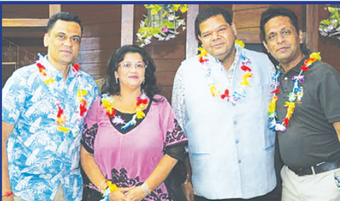
SPS SUPER STARS