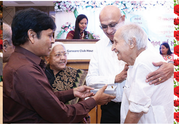
લક્ષ્મી ડ્રો વિજેતા