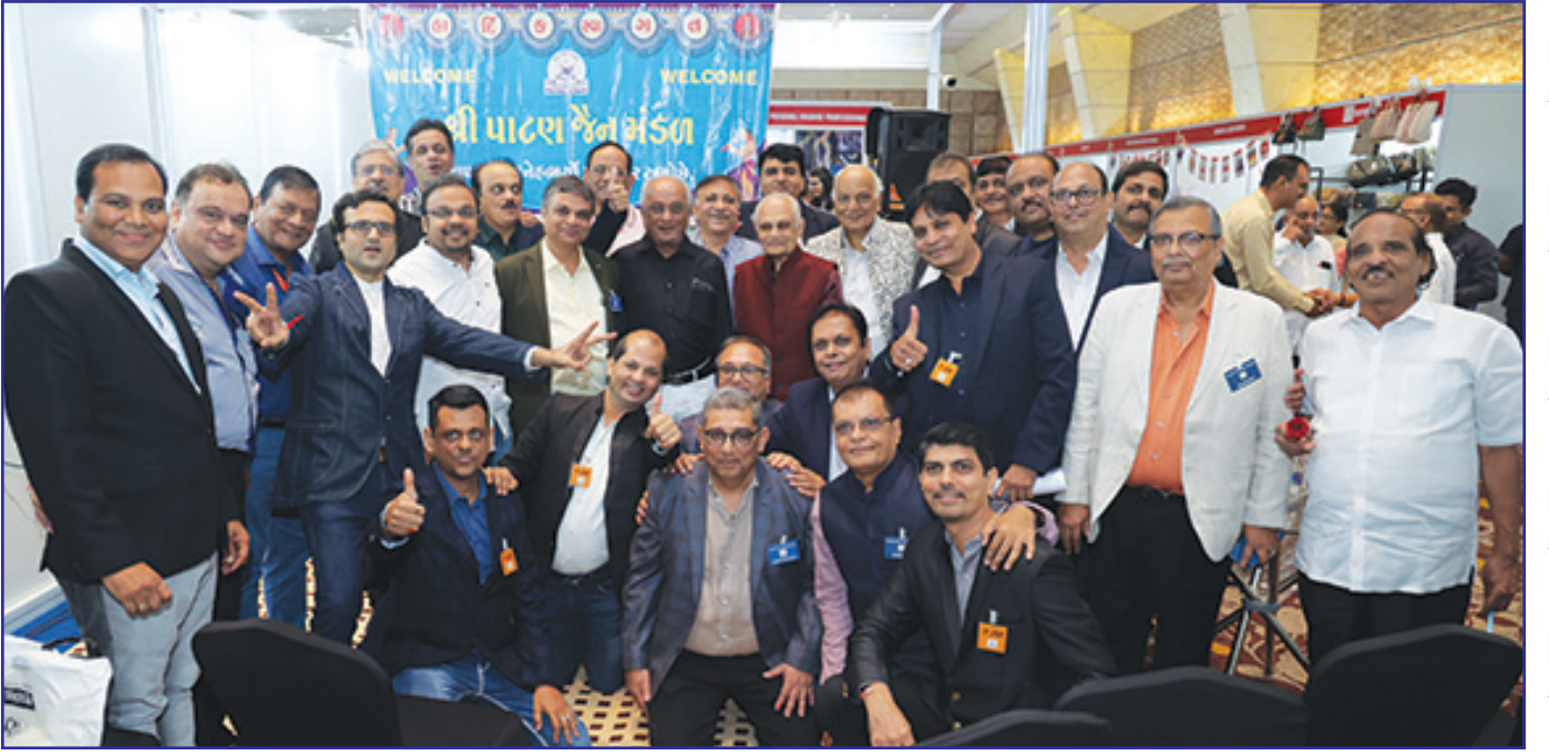
ટ્રેડફેરના દાતાઓ, હોદ્દેદારો તથા કાર્યકરો