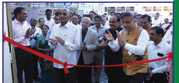
રીનોવેટ કરાયેલા વિદ્યાલયના એસી સેન્ટ્રલ હોલનું ઉદ્ઘાટન