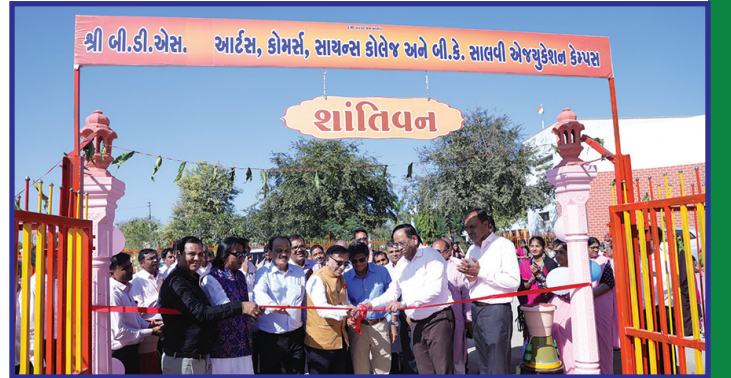
નવા તૈયાર કરેલા શાંતિવન, ભક્તિવન અને શક્તિવન ગાર્ડનોનું ઉદ્ઘાટન