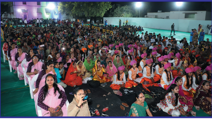
સ્પંદન કાર્યક્રમમાં ઉપસ્થિત જન સમુહ