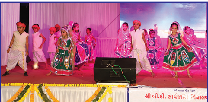
પ્રાથમિક શાળાના વિદ્યાર્થીઓ દ્વારા રજુ કરાયેલ કાર્યક્રમની ઝલક