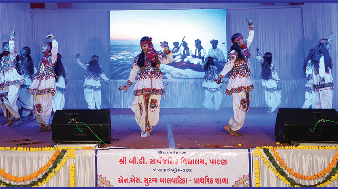
ઉચ્ચ માધ્યમિકના વિદ્યાર્થીઓ દ્વારા રજુ કરેલ સાંસ્કૃતિક કાર્યક્રમની ઝલક