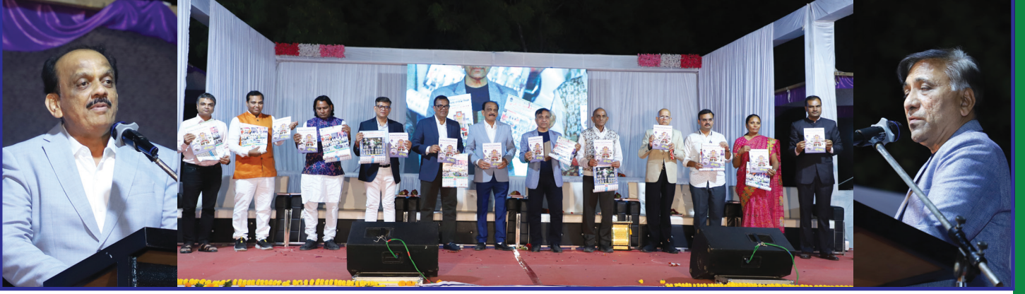
આયોજિત સ્પંદન કાર્યક્રમમાં વિદ્યાલયના વાર્ષિક પ્રકાશન અંક સૌરભ તથા ૨૦૨૩ના કેલેન્ડરનું વિમોચન કરતા મંચસ્થ મહાનુભવો