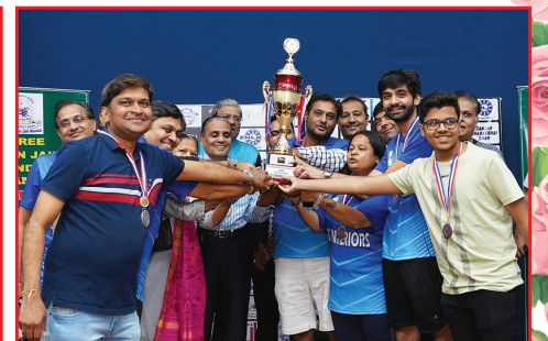
Runner up team VS Interiors