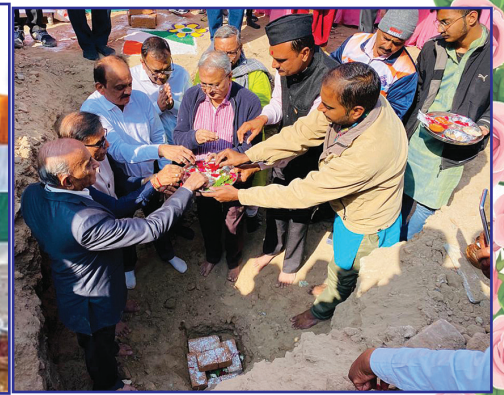
પ્રજાસત્તાક દિન ઉજવણી, પ્રાસંગિક સાંસ્કૃતિક कार्यक्रमની ઝલક