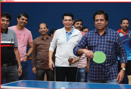
સ્પોર્ટ્સ ઓટ્સના હેડ શ્રી રોહીતભાઈ રમવાના મૂડમા