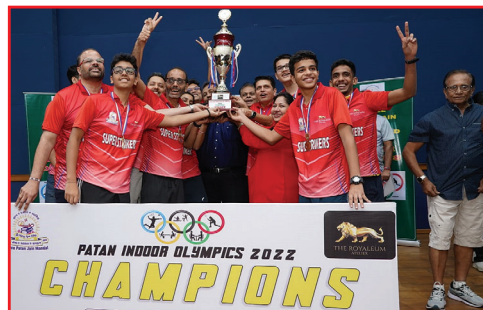
Winner team Super Strikers