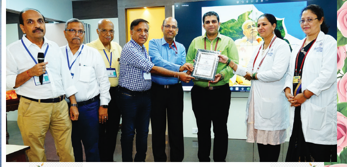
ભક્તિવેદાંત હોસ્પિટલના ડોક્ટરનું સન્માન કરતા સંસ્થાના પ્રમુખ તથા દાતાશ્રીઓ

શ્રી પાટણ જૈન મંડળ મેડિકલ સમિતિ દ્વારા ભક્તિવેદાંત હોસ્પિટલમાં તા. ૧૨ ફેબ્રુઆરી ૨૦૨૩ રવિવારના મેડિકલ કેમ્પનું આયોજન કરવામાં આવ્યું હતું જેમાં ૪૦ વર્ષથી વધુ વયના ૨૦૦થી અધિક ભાઈ-બહેનો જોડાયા હતા.