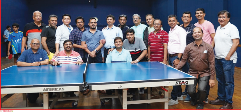
Sports committee & office bearers.