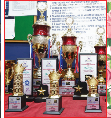
૮૦થી વધુ ટ્રોફી