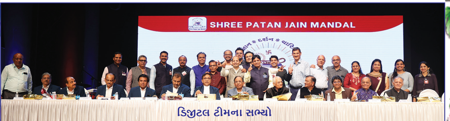
ડિજિટલ ટીમના સભ્યો

અને છેલ્લે આ સમગ્ર કાર્યક્રમમાં સીધી કે આડકતરી રીતે કાર્યમાં સહાયક થનાર નામી અનામી સર્વે પ્રતિ આભારની લાગણી વ્યક્ત કરવામાં આવે છે.