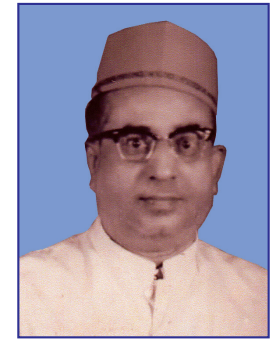
શ્રી શાંતિલાલ નગીનદાસ શાહ (વખતજીની શેરી) રૂા. ૧.૨૫ કરોડ

Printed & Published by BHARATI BHAGUBHAI SHAH on behalf of SHREE PATAN JAIN MANDAL and Printed at Arihant Printing Press, Bldg. No. 310, Saibaba Nagar, Pant Nagar, Ghatkopar (E), Mumbai-400075. And Published at 77, Patan Jain Mandal Marg, Marine Drive, Mumbai-400020.