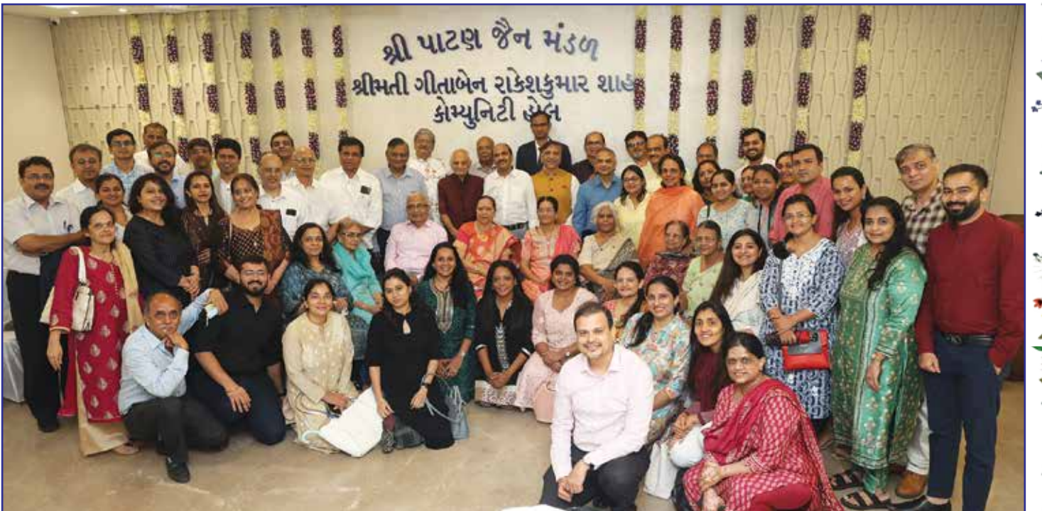
ઉપસ્થિત સમાજના ડૉક્ટર્સ અને મંડળના હોદ્દેદારો