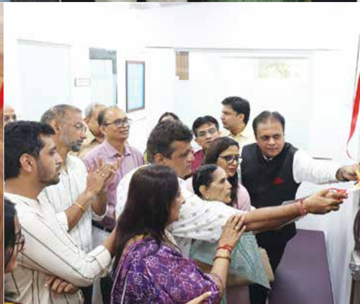
६ • ओक्टोबर, २०२३ • पाटणा प्रतिष्ठान