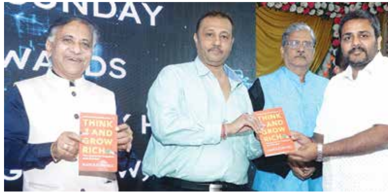
યુથ એમ્બાવરમેન્ટ કાર્યક્રમ તા. ૧૯ માર્ચ, ૨૦૨૩