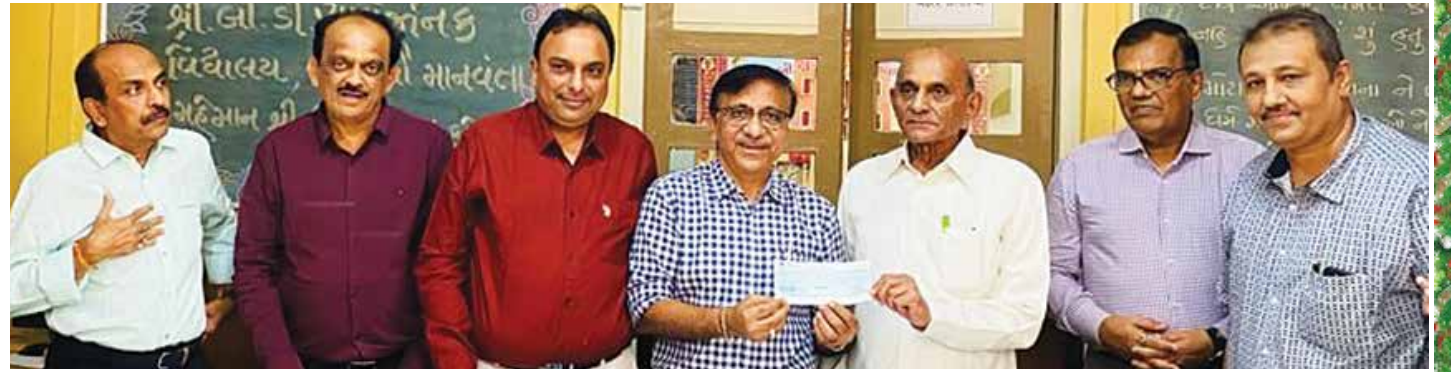
પ્રાથમિક શાળાના મુખ્ય દાતાના વરદ હસ્તે દાનનો ચેક અર્પણ તા. ૧૩મી નવેમ્બર ૨૦૨૨