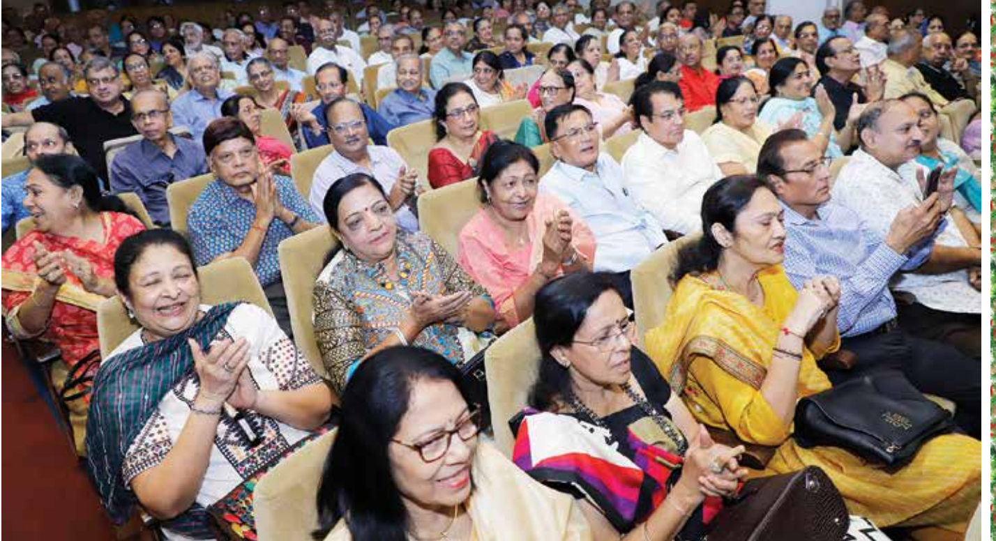
ઉપસ્થિત જન મેદની