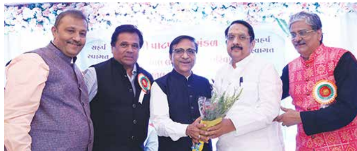
નૂતન વર્ષ સ્નેહ સમ્મેલન તા. ૫મી નવેમ્બર, ૨૦૨૨