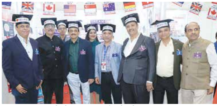
ટ્રેડફેરમાં તા. ૧૬મી ઓક્ટોબર, ૨૦૨૨