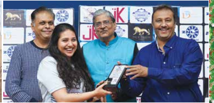
ઈન્ડોર ઓલિમ્પિક ગેમ તા. ૧૭, ૧૮ અને ૨૪મી ડિસેમ્બર, ૨૦૨૨