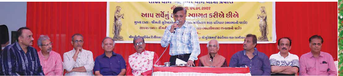
લોટાધામ-મહાવીરધામ જાત્રા તા. ૫મી જુન ૨૦૨૨