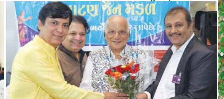
ટ્રેડફેરમાં દાતાઓનું અભિવાદન તા. ૧૬મી ઓક્ટોબર, ૨૦૨૨