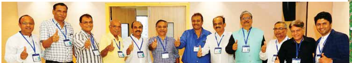
મેડિકલ કેમ્પ, ભાચંદર તા. ૧૨મી ફેબ્રુઆરી, ૨૦૨૩