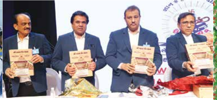
વસતી પત્રક વિમોચન તા. ૯ એપ્રિલ, ૨૦૨૩