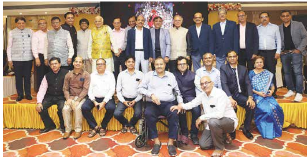
સૌરભ મેડિકલ હેલ્થકેર, ગોરેગામ તા. ૧૫ ઓક્ટોબર, ૨૦૨૩