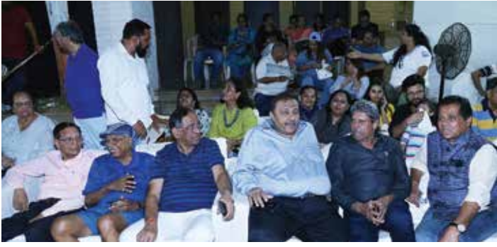
પાટણ પ્રિમિયર લીગ સીઝન ૬, ૨૦૨૩ તા. ૨૬મી ફેબ્રુઆરી, ૨૦૨૩