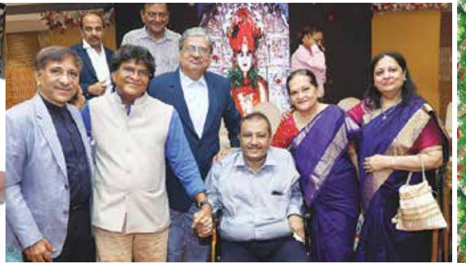
સૌરભ મેડિકલ હેલ્થકેર, ગોરેગામ તા. ૧૫ ઓક્ટોબર, ૨૦૨૩