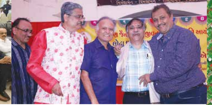
લોટાધામ-મહાવીરધામ જાત્રા તા. ૫મી જુન ૨૦૨૨