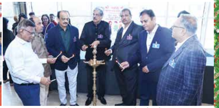
યુવા-યુવતી પરિચય મિલન તા. ૧૬મી ઓક્ટોબર, ૨૦૨૨