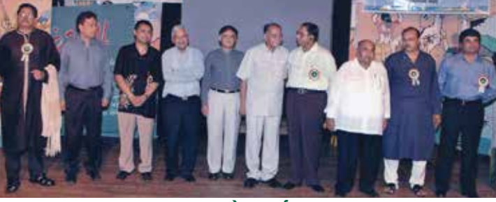
ગ્રુવન મહેક કાર્યક્રમ