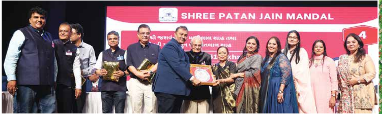
દાતા પરિવારનું અભિવાદન તા. ૯ એપ્રિલ, ૨૦૨૩