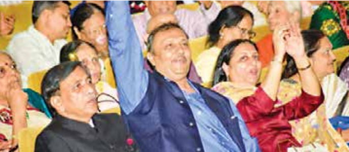
સુહાના સફર તા. ૧૨મી જુન ૨૦૨૨