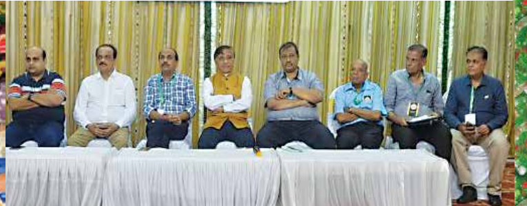
મેડિકલેઈમ પોલીસી સેમિનાર તા. ૨૪મી જુલાઈ, ૨૦૨૨