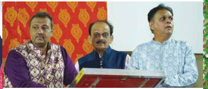
પાલીતાણા યાત્રા પ્રવાસ તા. ૧૦ થી ૧૩મી જાન્યુઆરી, ૨૦૨૩