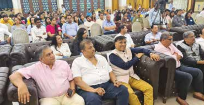
નેટવર્કિંગ, એન્ટર્નશીપ અને સ્ટાર્ટ એપ મેન્ટોરશીપ ઈવેન્ટ, તા. ૮મી મે, ૨૦૨૨