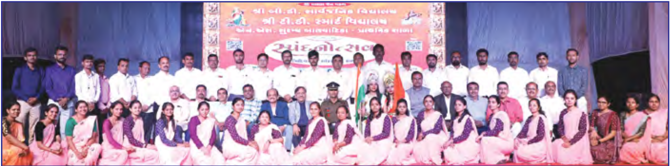
સ્વંદનોત્સવ સંપૂર્ણ કાર્યક્રમને તૈયાર કરનાર કન્વીનરો તથા હોદ્દેદારો અને લોકલ સમિતિ