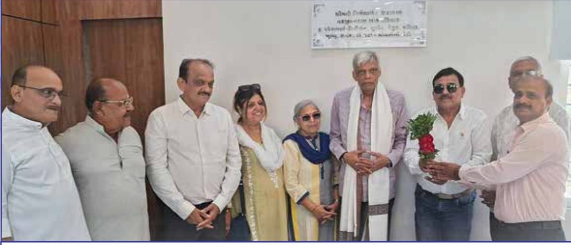
ટી.ડી. સ્માર્ટ વિદ્યાલય પાટણ પ્રિન્સીપલ ઓફિસ તથા કેન્ટીન વિભાગમાં દાન આપનાર દાતાશ્રી પરિવારનું અભિવાદન