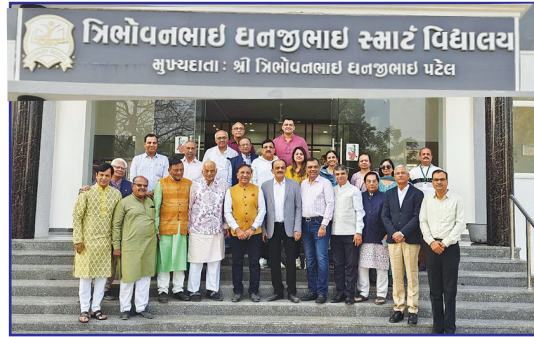
શ્રી ટી.ડી.એસ. વિદ્યાલયની મહેમાનો દ્વારા શુભેચ્છા મુલાકાત