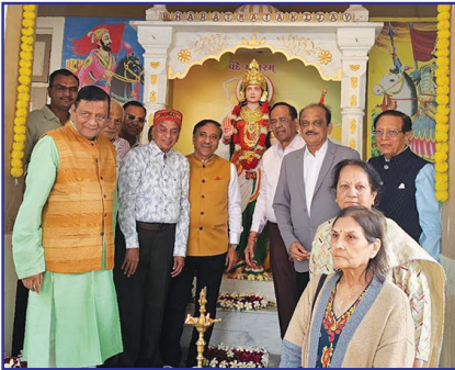
મહેમાનો દ્વારા દીપ પ્રાગટ્ય

આપને વિદીત થાય કે ૪૫૦ વિદ્યાર્થીઓ, ૩૦ શિક્ષકગણ, સ્ટાફ અને કોરિયોગ્રાફર દ્વારા તૈયાર કરાયેલ ધાર્મિક તથા દેશભક્તિની લગભગ ૨૦ લાઈવ કૃતિઓ સાથેનું પ્રદર્શન તથા સાંસ્કૃતિક કાર્યક્રમ તૈયાર કરાયો હતો જેને પાટણ નગરની વિવિધ સ્કુલોના વિદ્યાર્થીઓ નગરજનો તથા બહારગામથી પધારેલ ભૂતપૂર્વ વિદ્યાર્થીઓ સહીત કુલ ૨૨૦૦૦ની જન મેદનીએ ત્રણ દિવસ દરમ્યાન નિહાળ્યા હતા. આવા ગૌરવશાળી મહોત્સવની સફળતા બદલ ઉપરોક્ત ચાર શિક્ષકગણનું મોમેન્ટો અર્પણ કરી સન્માન કરાયું હતું.