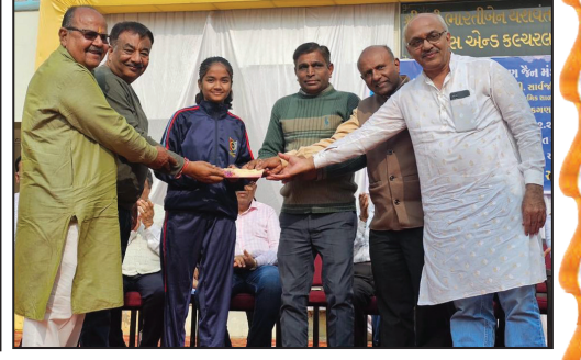
શિક્ષણ ક્ષેત્રે ઉત્કૃષ્ટ દેખાવ કરનાર વિદ્યાર્થીઓનું સન્માન