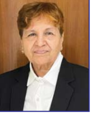
પ્રિય મિત્રો ! પ્રણામ